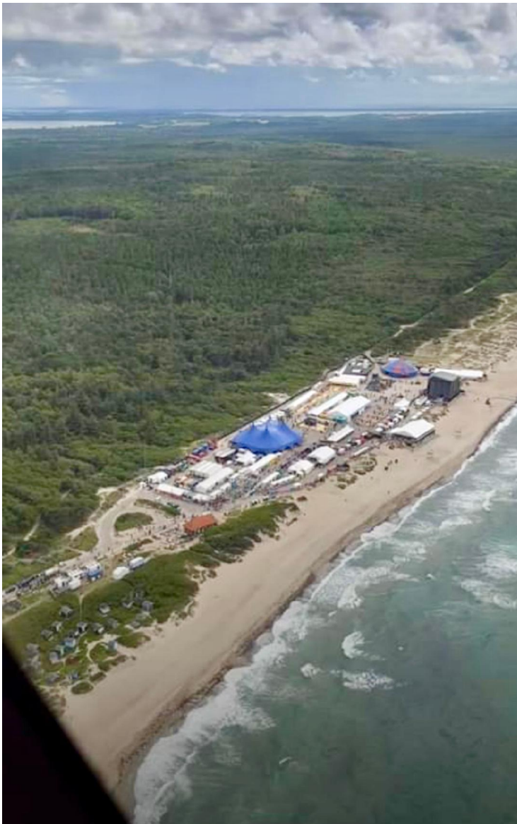
Foto: Festival området med det foreslåede Ankomstområde Øst til venstre i billedet. Området har allerede i et vist omfang været inddraget forudgående år.