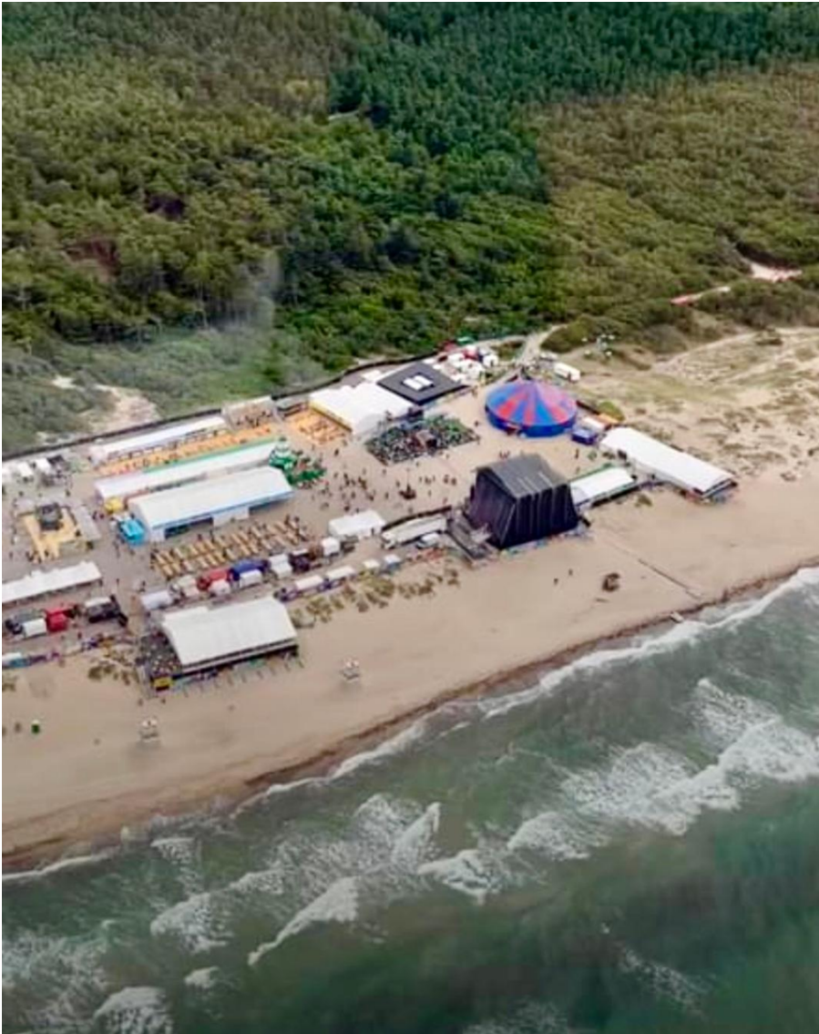
Foto: Festival området med det foreslåede Ankomstområde Vest til højre i billedet. Det er på dette foto synligt hvorledes klitrækken ud mod kysten er blevet brudt op.

Området lige ved siden af er levested for bilag IV arten markfirben.