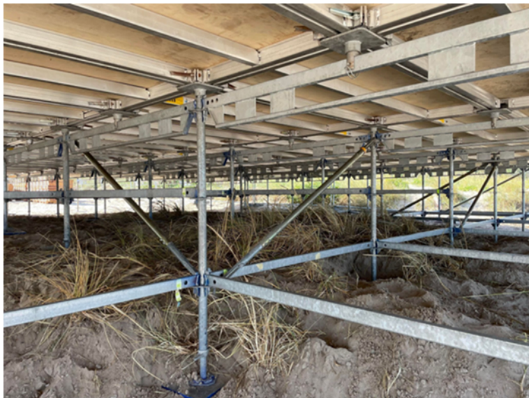
Foto: Genplantning af marehalm under stilladset i 2022,

kunne fortsætte. Ved den lejlighed udtalte Naturstyrelsen, ” at klitterne er blevet genetableret på tilfredsstillende vis og at det ikke vil få betydning for livet i klitterne. Klitterne i Tisvilde er vant til at flytte sig, og planterne er robuste, så de kan godt tåle at blive hevet op af jorden og beplantet igen.”