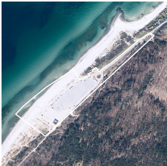
Foto: Området der er omfattet af lokalplan forslaget.